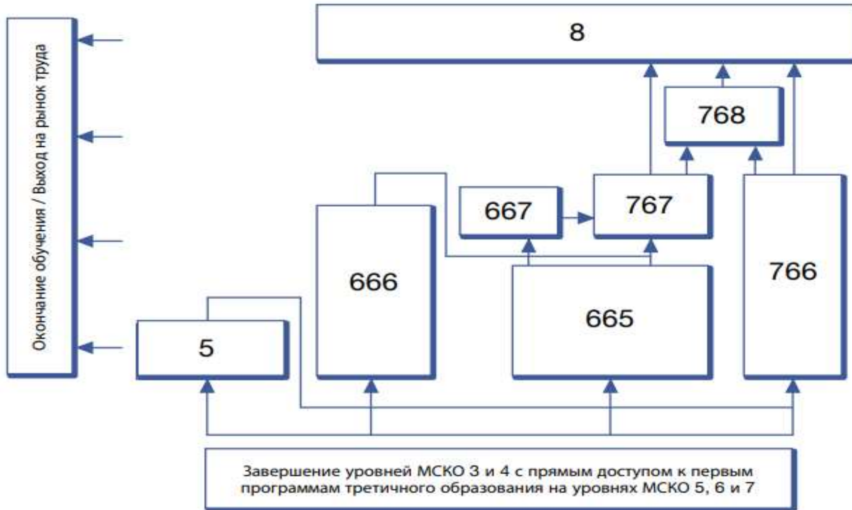
Схема 1. Пути перехода третичного образования в рамках МСКО